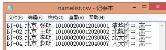
图 2. 选手名单示例