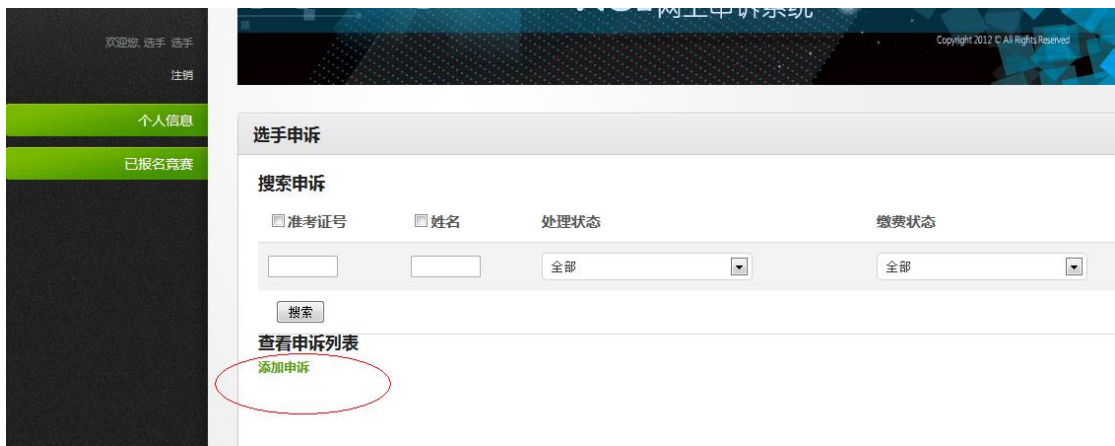
图 3， 选手申诉列表

步骤三、点击“添加申诉”链接进入申诉表页面，选手填写“准考证号”，“申诉题目”，“申诉要求”，“申诉要求理由及依据”后，点击“提交”按钮提交此次比赛该题的申诉。该申诉将被送往选手指导老师等待指导老师审批。