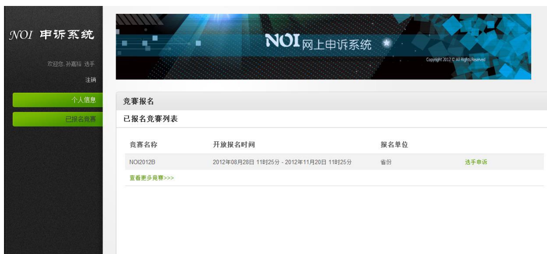
图 2，选手已报名竞赛列表

步骤二、选手输入账号 contestant_account，密码为 contestant_password，验证码后登陆系统点击左边“已报名竞赛”进入已报名竞赛列表如图 2。点击对应申诉比赛的“选手申诉”链接，进入该比赛申诉列表，初始申诉列表为空。