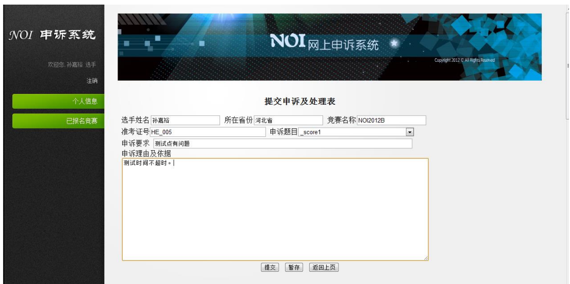
图 4， 选手填写申诉表页面

步骤三、点击“添加申诉”链接进入申诉表页面，选手填写“准考证号”，“申诉题目”，“申诉要求”，“申诉要求理由及依据”后，点击“提交”按钮提交此次比赛该题的申诉。该申诉将被送往选手指导老师等待指导老师审批。