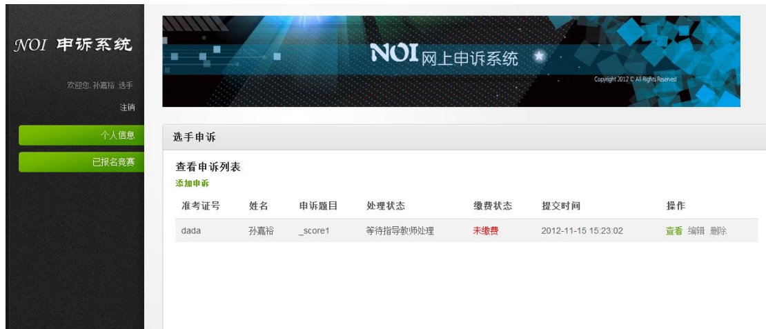
图 5， 选手提交申诉后返回到申诉列表页面